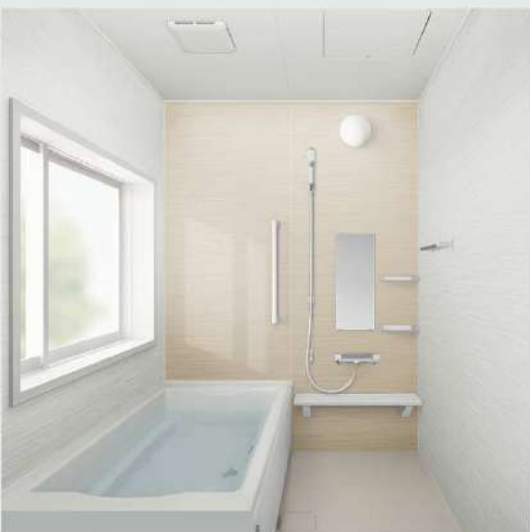
ウェーブベージュ