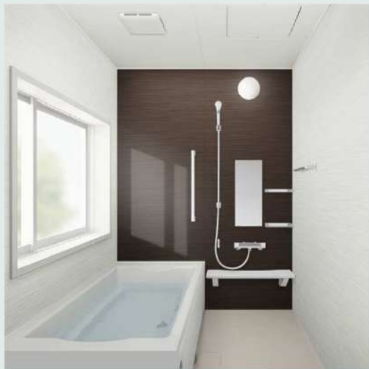
ウェーブブラウン