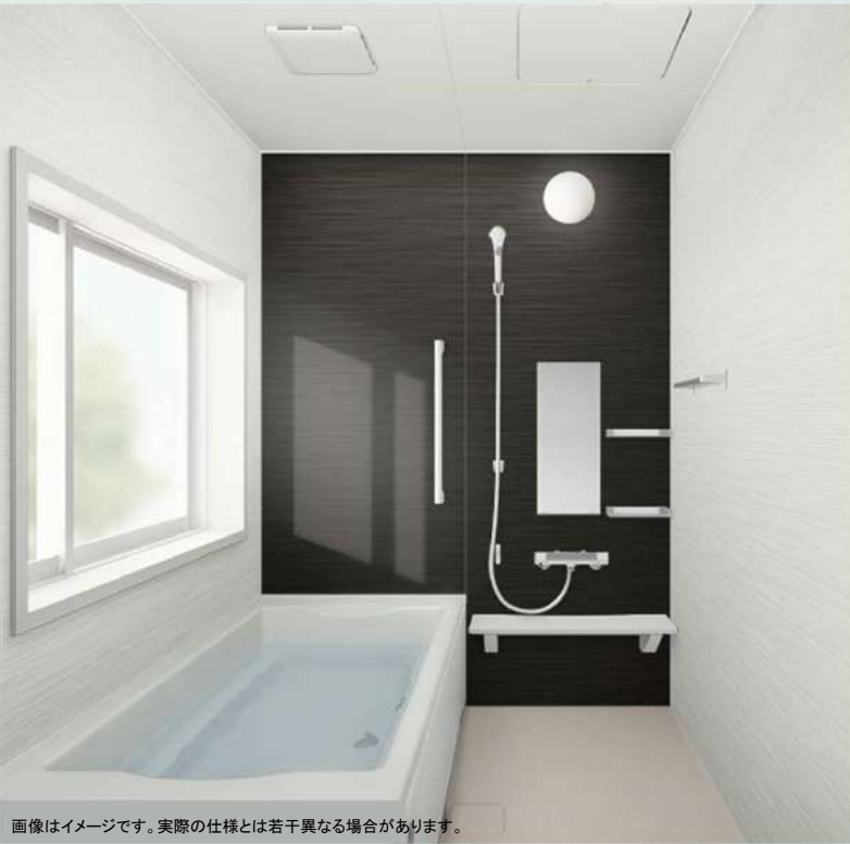
画像はイメージです。実際の仕様とは若干異なる場合があります。