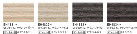
EH4831* QFシュタイン チタン アイボリー マンセル値 0.5Y 6.7/2.1 EH4832* QFシュタイン チタン ベージュ マンセル値 1.5Y 6.5/1.6 EH4833* QFシュタイン チタン ブラウン マンセル値 9YR 3.4/0.5 EH4834* QFシュタイン チタン ダークレッド マンセル値 8R 3/0.5