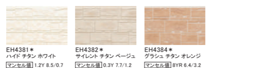
EH4381* ハイド チタン ホワイト マンセル値 1.2Y 8.5/0.7 EH4382* サイレント チタン ベージュ マンセル値 0.3Y 7.7/1.2 EH4384* グラッシュ チタン オレンジ マンセル値 8YR 6.4/3.2