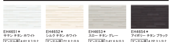
EH4651* サテン チタン ホワイト マンセル値 4.6Y 8.7/0.2 EH4652* シルク チタン ホワイト マンセル値 2Y 8.2/0.9 EH4653* スロー チタン グレー マンセル値 3.4Y 6.9/0.3 EH4654* アイボリー チタン ブラック マンセル値 4.2P 3.1/0.2