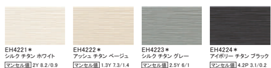
EH4221* シルク チタン ホワイト マンセル値 2Y 8.2/0.9 EH4222* アッシュ チタン ベージュ マンセル値 1.3Y 7.3/1.4 EH4223* シルク チタン グレー マンセル値 2.5Y 6/1 EH4224* アイボリー チタン ブラック マンセル値 4.2P 3.1/0.2