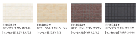
EH4041* QFソブラ チタン ホワイト マンセル値 2.2Y 8.4/0.6 EH4042* QFアーベント チタン ベージュ マンセル値 0.8Y 7/2 EH4043* QFアーベント チタン ブラウン マンセル値 4YR 4.2/1.2 EH4044* QFソブラ チタン ブラック マンセル値 7.6RP 3.4/0.1