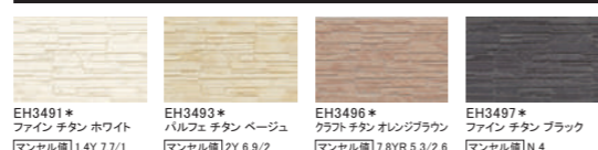
EH3491* ファイン チタン ホワイト マンセル値 1.4Y 7.7/1 EH3493* ハルフェ チタン ベージュ マンセル値 2Y 6.9/2 EH3496* クラフト チタン オレンジブラウン マンセル値 7.8YR 5.3/2.6 EH3497* ファイン チタン ブラック マンセル値 N 4