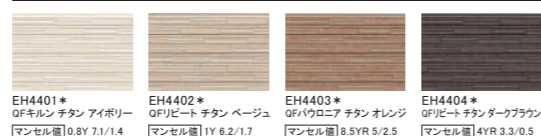
EH4401* QFキルン チタン アイボリー マンセル値 0.8Y 7.1/1.4 EH4402* QFリビート チタン ベージュ マンセル値 1Y 6.2/1.7 EH4403* QFハローニア チタン オレンジ マンセル値 8.5YR 5.2/2.5 EH4404* QFリビート チタン ダークブラウン マンセル値 4YR 3.3/0.5