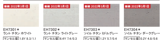
EH7301* ラント チタン ホワイト マンセル値 1.8Y 8.3/1.1 EH7302* ラント チタン ライトグレー マンセル値 6.4Y 7.4/0.3 EH7303* ソイル チタン ミドルグレー マンセル値 1.2Y 5.7/0.4 EH7304* ソイル チタン ダークグレー マンセル値 0.2Y 4.8/0.6