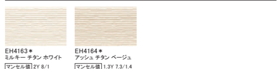
EH4163* ミルキー チタン ホワイト マンセル値 2Y 8/1 EH4164* アッシュ チタン ベージュ マンセル値 1.3Y 7.3/1.4