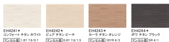
EH4241* コンフォート チタン ホワイト マンセル値 1.8Y 7.9/0.7 EH4242* ビュア チタン ベージュ マンセル値 0.6Y 7.6/1.5 EH4243* カーラ チタン オレンジ マンセル値 10YR 6/3 EH4244* ポワ チタン ブラック マンセル値 5R 4/1