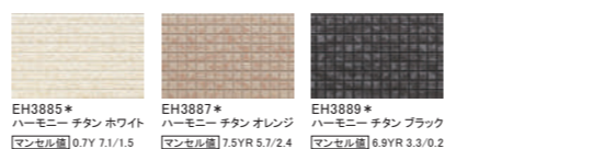
EH3885* ハーモニー チタン ホワイト マンセル値 0.7Y 7.1/1.5 EH3887* ハーモニー チタン オレンジ マンセル値 7.5YR 5.7/2.4 EH3889* ハーモニー チタン ブラック マンセル値 6.9YR 3.3/0.2