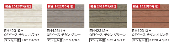
EH42310* QFピース チタン ホワイト マンセル値 1.8Y 7.8/0.9 EH42311* QFピース チタン グレー マンセル値 1Y 5.3/0.8 EH42312* QFピース チタン グリーン マンセル値 6.5Y 4.3/1.2 EH42313* QFピース チタン オレンジ マンセル値 5.2YR 4.5/3.7