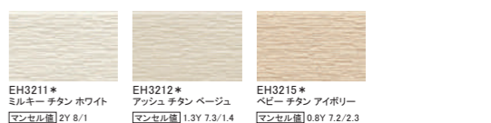
EH3211* ミルキー チタン ホワイト マンセル値 2Y 8/1 EH3212* アッシュ チタン ベージュ マンセル値 1.3Y 7.3/1.4 EH3215* ペビー チタン アイボリー マンセル値 0.8Y 7.2/2.3