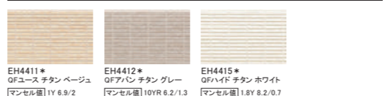
EH4411* QFユース チタン ベージュ マンセル値 1Y 6.9/2 EH4412* QFアハレン チタン グレー マンセル値 10YR 6.2/1.3 EH4415* QFハイド チタン ホワイト マンセル値 1.8Y 8.2/0.7