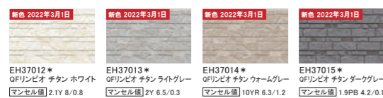
EH37012* QFリンピオ チタン ホワイト マンセル値 2.1Y 8/0.8 EH37013* QFリンピオ チタン ライトグレー マンセル値 2Y 6.5/0.3 EH37014* QFリンピオ チタン ウォームグレー マンセル値 10YR 6.3/1.2 EH37015* QFリンピオ チタン ダークグレー マンセル値 1.9PB 4.2/0.1