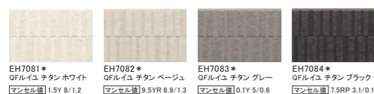
EH7081* QFルイユ チタン ホワイト マンセル値 1.5Y 8/1.2 EH7082* QFルイユ チタン ベージュ マンセル値 9.5YR 6.9/1.3 EH7083* QFルイユ チタン グレー マンセル値 0.1Y 5/0.6 EH7084* QFルイユ チタン ブラック マンセル値 7.5RP 3.1/0.1