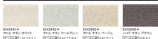
EH3941* サトル チタン ホワイト マンセル値 1.3Y 7.5/1.1 EH3942* サトル チタン グレー マンセル値 4.5Y 7.2/0.4 EH3945* サトル チタン ベージュ マンセル値 0.8Y 7/1.7 EH3946* ハイド チタン ブラウン マンセル値 5YR 5/1