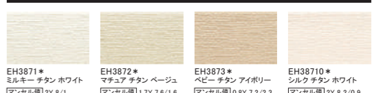
EH3871* ミルキー チタン ホワイト マンセル値 2Y 8/1 EH3872* マチュア チタン ベージュ マンセル値 1.7Y 7.6/1.6 EH3873* ペビー チタン アイボリー マンセル値 0.8Y 7.2/2.3 EH38710* シルク チタン ホワイト マンセル値 2Y 8.2/0.9