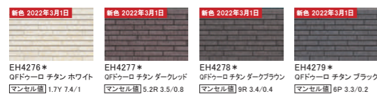
EH4276* QFドゥーロ チタン ホワイト マンセル値 1.7Y 7.4/1 EH4277* QFドゥーロ チタン ダークレッド マンセル値 5.2R 3.5/0.8 EH4278* QFドゥーロ チタン ダークブラウン マンセル値 9R 3.4/0.4 EH4279* QFドゥーロ チタン ブラック マンセル値 6P 3.3/0.2