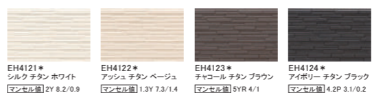
EH4121* シルク チタン ホワイト マンセル値 2Y 8.2/0.9 EH4122* アッシュ チタン ベージュ マンセル値 1.3Y 7.3/1.4 EH4123* チャコール チタン ブラウン マンセル値 5YR 4/1 EH4124* アイボリー チタン ブラック マンセル値 4.2P 3.1/0.2